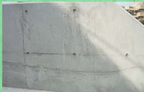
コールドジョイント