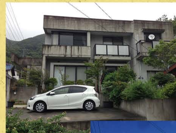
築年数がたっても、 新築状態へ改修可能