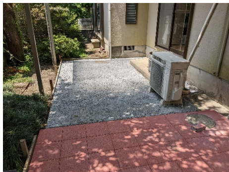
① オワコン入カ転圧

概要：テラス下部の防草土間として オワコン 施工（撒いて踏むだけ） （防草土間：5cm厚）